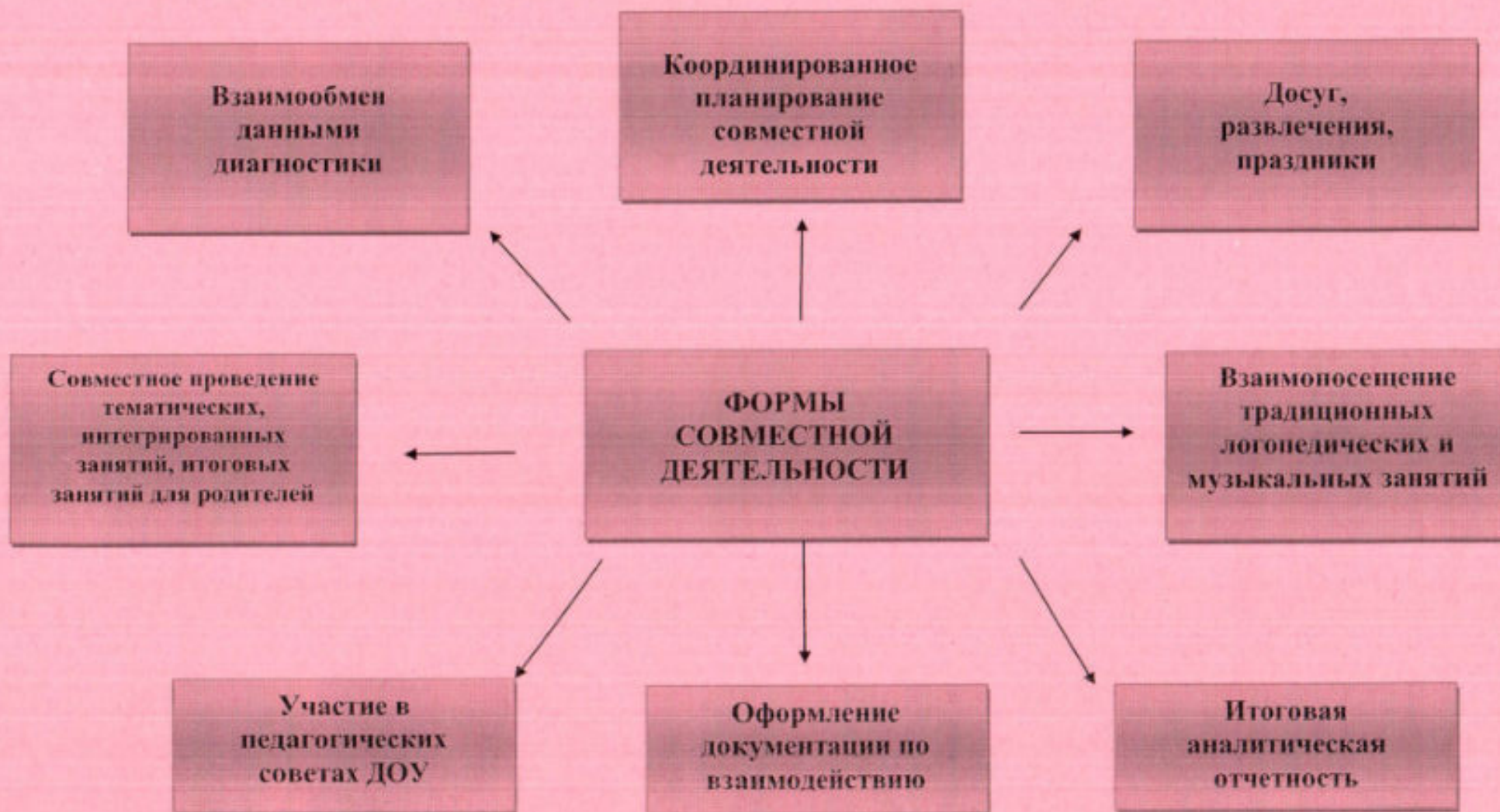
Схема взаимодействия учителя – логопеда и музыкального руководителя