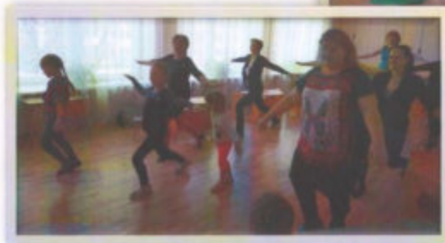
Презентация проекта. Родительском клуб «Стрекоза»