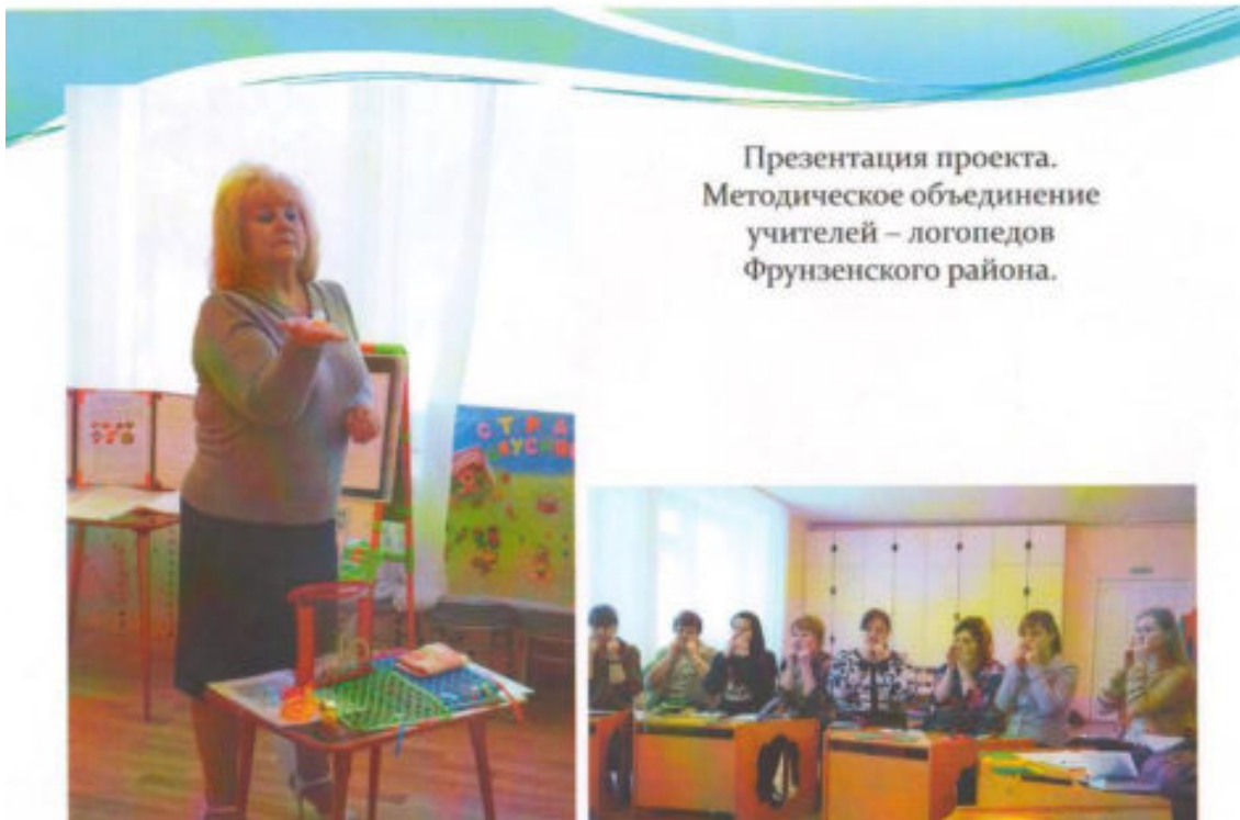
Презентация проекта. Методическое объединение учителей – логопедов Фрунзенского района.